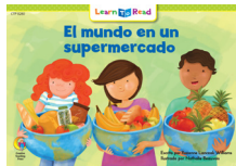
E 8280 NF El mundo en un supermercado