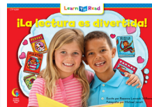
C 8289 F ¡La lectura es divertida!