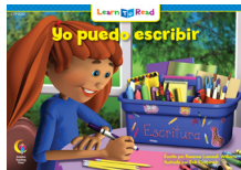
C 8262 F Yo puedo escribir