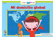
D 8282 NF Mi domicilio global