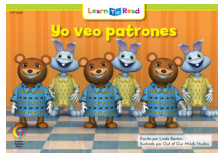
D 8268 NF Yo veo patrones