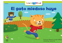
D 8272 F El gato miedoso huye