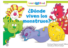
D 8259 F ¿Dónde viven los monstruos?