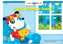
C 8247 NF ¿Qué tiempo hace?