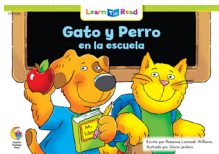
E 8285 F Gato y Perro en la escuela