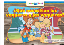
C 8290 F ¿Qué necesitan los vaqueros y las vaqueras?