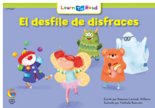
D 8267 NF El desfile de disfraces