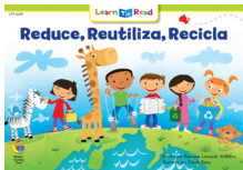
D 8249 NF Reduce, Reutiliza, Recicla