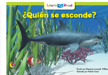
D 8254 NF ¿Quién se esconde?