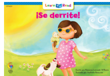
B 8251 NF ¡Se derrite!