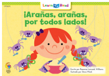
D 8273 F ¡Arañas, arañas, por todos lados!