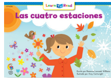
B 8246 NF Las cuatro estaciones