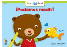
F 8274 NF ¡Podemos medir!