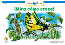
C 8245 NF ¡Mira cómo crece!