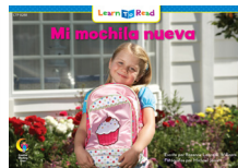
C 8288 F Mi mochila nueva