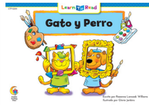
C 8264 F Gato y Perro