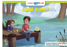
F 8258 NF ¿Qué pasó?