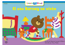
C 8270 F El oso Barney se viste