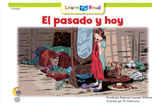
D 8284 NF El pasado y hoy