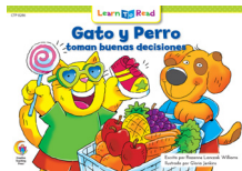
E 8286 NF Gato y Perro toman buenas decisiones