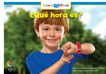
C 8269 NF ¿Qué hora es?