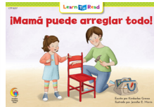
E 8257 NF ¡Mamá puede arreglar todo!