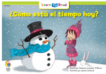
E 8255 NF ¿Cómo está el tiempo hoy?