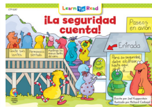
D 8287 NF ¡La seguridad cuenta!