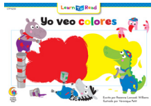
B 8250 NF Yo veo colores