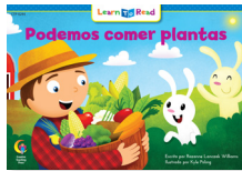
B 8244 NF Podemos comer plantas