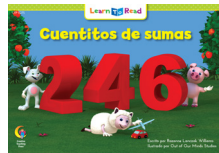
D 8275 NF Cuentitos de sumas