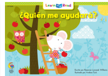
D 8265 F ¿Quién me ayudará?