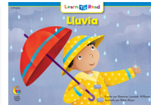
C 8260 F Lluvia