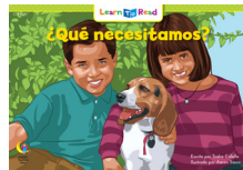
D 8281 NF ¿Qué necesitamos?