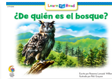
C 8248 NF ¿De quién es el bosque?