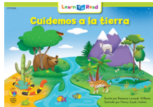
F 8256 NF Cuidemos a la tierra