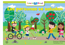
D 8277 NF Las personas se saludan