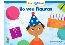
C 8266 NF Yo veo figuras