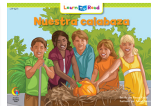
D 8271 NF Nuestra calabaza