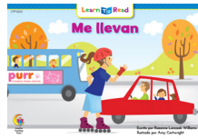
C 8252 NF Me llevan