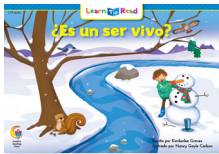
B 8243 NF ¿Es un ser vivo?

Language Arts • Science • Math • Social Studies