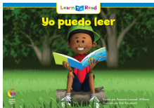
C 8261 F Yo puedo leer