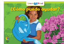
D 8278 F ¿Cómo puedo ayudar?