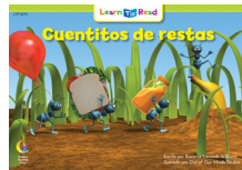
D 8276 NF Cuentitos de restas