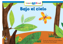
C 8263 F Bajo el cielo