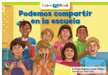
D 8279 NF Podemos compartir en la escuela