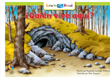
D 8253 NF ¿Quién vive aquí?